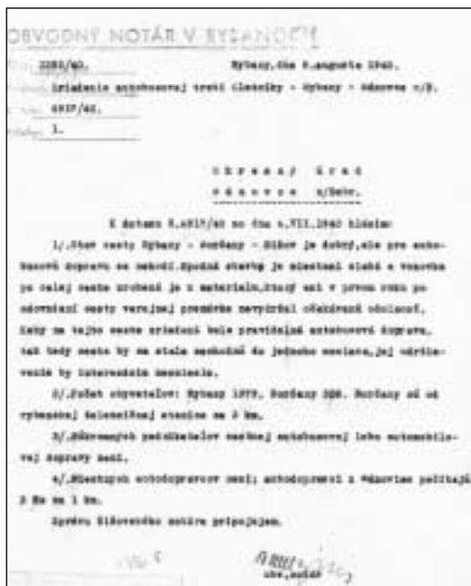
Zriadenie autobusovej trate Zlatníky-Rybany-Bánovce n.B.

notára z Rybian, ktorý sa obával, že kvalita cesty medzi Šišovom a Borčanmi by nezniešla pravidelnú dopravu a preto nesúhlasil so zriadením tejto linky. 13