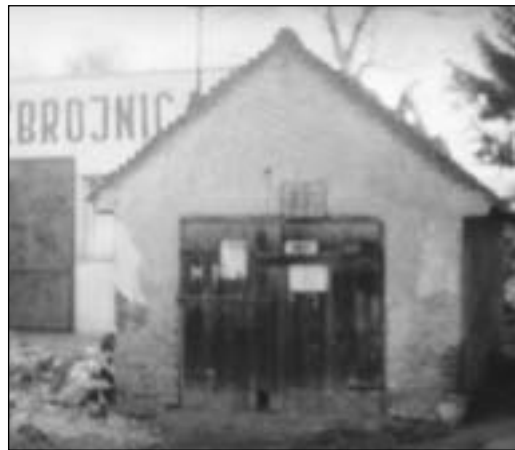
Stará požiarňa zbrojnica

Posledné voľby do národného výboru sa uskutočnili v júni 1986. Ustanovujúce plénum sa konalo 28. júna 1986. Zloženie národného výboru bolo podobné ako v predchádzajúcom volebnom období. Z celkového počtu 21 poslancov bolo 12 robotníkov, 3 zástupcovia inteligencie a 6 technicko-hospodárskych pracovníkov. Z hľadiska vekového zloženia to bolo 7 poslancov do 35 rokov, 12 35–60, 2 nad 60 a 5 žien. 65 Realizovať svoj volebný program tento národný výbor už nestihol. Spoločenské zmeny, ktoré sa začali 17. novembrom 1989, znamenali koniec éry budovania komunizmu v Československu a začiatok novej etapy histórie Slovenska.