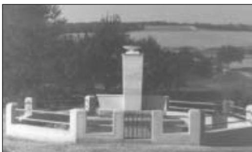
Pomník obetí 2. svetovej vojny