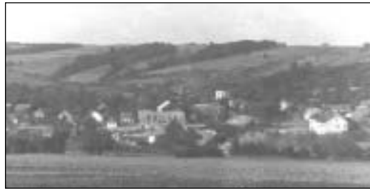
Zlatníčky v šesťdesiatych rokoch 20. storočia

Každým rokom pribúdali v obci novostavby rodinných domov. Staré domy z nepálených tehál pomaly ustupovali novostavbám poskytujúcim omnoho vyšší životný štandard a obec výrazne menila svoju tvár. V roku 1961 bolo v Zlatníkoch už len 14 domov postavených do roku 1879. Domov postavených od oslobodenia do roku 1961 bolo 74. 55