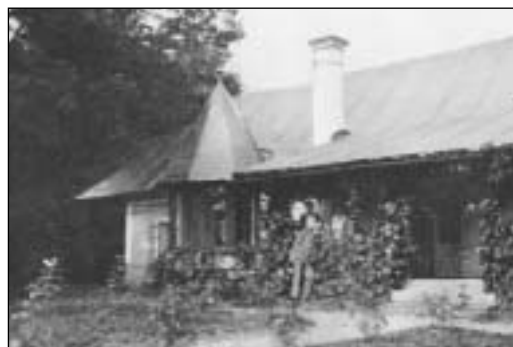
Starý poľovnícky kaštieľ na Kulháni (1935)