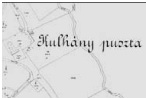
Kulhánsky dvor na mape z roku 1906