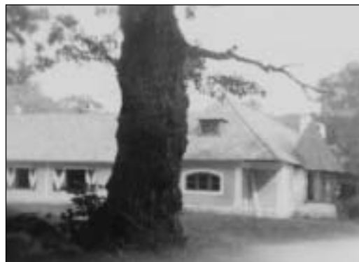
Starý poľovnícky kaštieľ - pohľad od juhozápadu (1919)

Z cirkevného schematizmu sa dozvedáme, že v roku 1826 žilo na kulhánskom majeri 17 osôb. O dva roky neskôr tam narátali 23 duší.