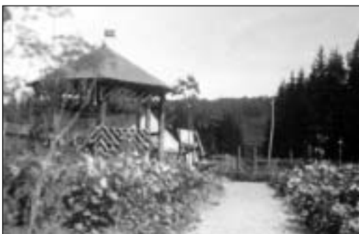
Altánok v záhrade za ubytovňou lesných zamestnancov

Začiatkom augusta 1925 sa po predchádzajúcich výdatných dažďoch prehnala poľsím silná víchrica od severozápadu a z dôvodu rozmočenej pôdy spôsobila vývraty stromov na niekoľkých desiatkach hektárov v lesných oddieloch Jelenie jamy, Hlboká, Burdijarok a Horný lom. Krutá zima na prelome rokov 1928/29 takisto spôsobila značné škody na porastoch.