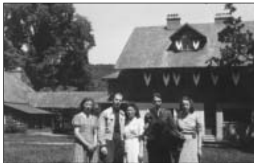
Zamestnanci polesia Kulháň, vzadu nový poľovnícky kaštieľ (1938)