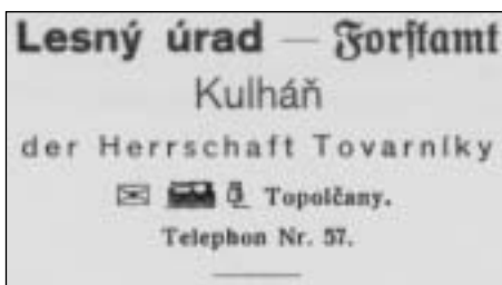
Označenie firemnej korešpodencie sídla lesnej správy