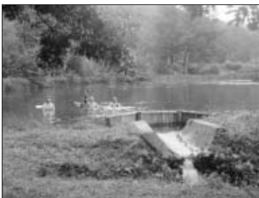
Rybník na Chocinke powyše Kulháňa (1928)