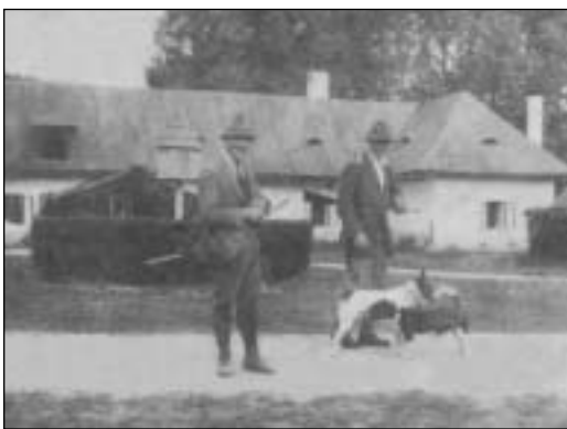
Nádvorie kulhánskeho majera (september 1921)