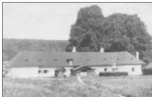
Kulháňsky hospodársky dvor

je odvodený od staronemeckého hovorového výrazu kriesen vo význame opustený, pustý či osamote stojaci. To isté platí o Šiancoch v susednom chotári. Vznikli z nemeckého slova die Schanze , Schanzen = hradba, hradby, hradisko, valy, resp. opevnená plocha. A rovnako tak tomu bolo aj u ďalších chotárnych názvov, z nich mnohé postupom času zanikli.