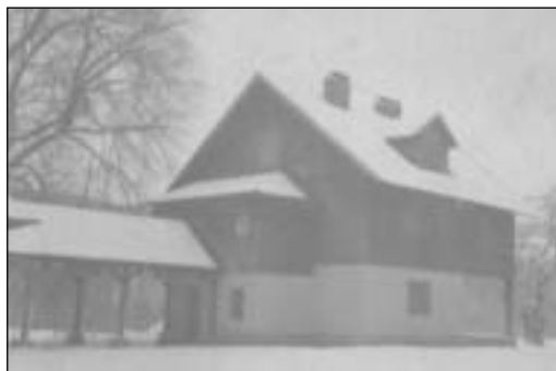
Novostavba poľovníckej chaty (letohrádku) z r. 1937

Dňa 21. marca 1940 došlo ku vlámaniu do spomínaného letohrádku (kaštieľa). Z kaštieľa bolo odcudzených množstvo vecí v celkovej hodnote 17 731 korún. Ako páchatelia boli ši-