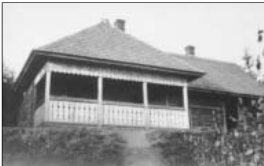
Lovecká chata „Hubertka“ na Poľane stála neďaleko dnešnej chaty Kubánky (1920)

na Poľane (v Žiaroch), v horách nad Zlatníkmi. Stála v blízkosti dnešnej chaty Kubánky. Lovec- ké chaty sa stali obľúbeným miestom výletov celej barónovej rodiny ako aj jej hostí.